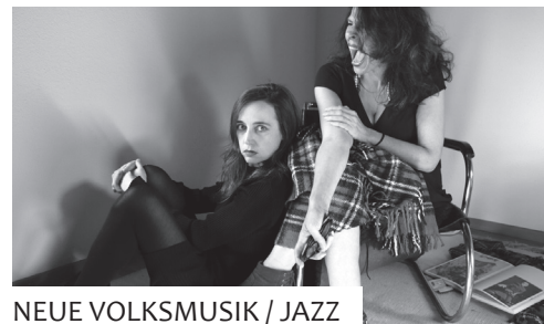
NEUE VOLKSMUSIK / JAZZ

Die zwei Musikerinnen aus dem Umfeld des Jazz spielen alte Volkslieder und Vertonungen schweizerdeutscher Gedichte. Mit präpariertem Klavier, Reisealphorn, anachroner Yamaha-Orgel und Spielzeuginstrumenten klingen die Volkslieder aktuell und bleiben gerade deswegen authentisch.