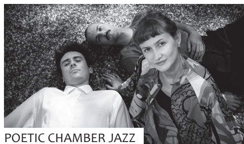
POETIC CHAMBER JAZZ

Poetic Chamber Jazz bezeichnet die Musik des Trios, welches Singer-Songwriting mit Nordic- und Modern-Jazz verbindet. Die melodischen Songs aus der Feder der Bandleaderin werden aus Jazz-Harmonien und rhythmischen Pattern gewebt und von improvisierten Klangwelten umspült.